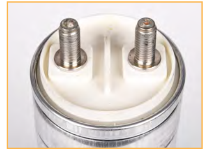
Terminali a vite M10 M10 screw terminals