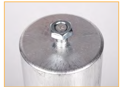
Fissaggio codolo filettato M12 M12 stud fixing