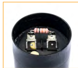
Resistenza di scarica Discharge resistor