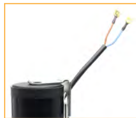
Cavo bipolare Bipolar wire